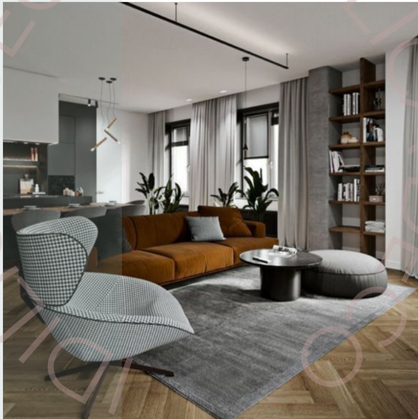
Combinación de líneas rectas y curvas balanceada

Colocar líneas iguales en nuestras decoraciones si bien parece simple, en Idilica siempre decimos que es una de las cuestiones mas difíciles de lograr ya que si no somos estrategicos, se puede generar monotonía y el espacio queda poco armónico y aburrido. En espacios comerciales, nuestra estadia es por cortos lapsos de tiempo, pero en una casa donde vivimos, pasamos mucho tiempo y esto puede llegar a aburrirnos si es que no somos personas disruptivas por eso, en estos casos recomendamos romper estas líneas. ¿Cómo? Cambiando la mesa circular por una rectangular o cuadrada (de líneas rectas).