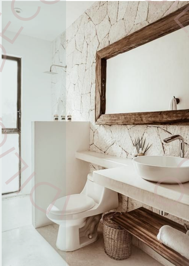
Ejemplo de espacio con texturas rústicas

Por ejemplo, si generamos un ambiente con mucho relieve, vamos a percibir que tenemos demasiados estímulos visuales. Y esto puede generar que el espacio se vea muy sobrecargado. De lo contrario, si optamos por todas superficies planas o lisas, el espacio lucirá monótono y sin gracia. Por eso, es súper importante combinarlas.