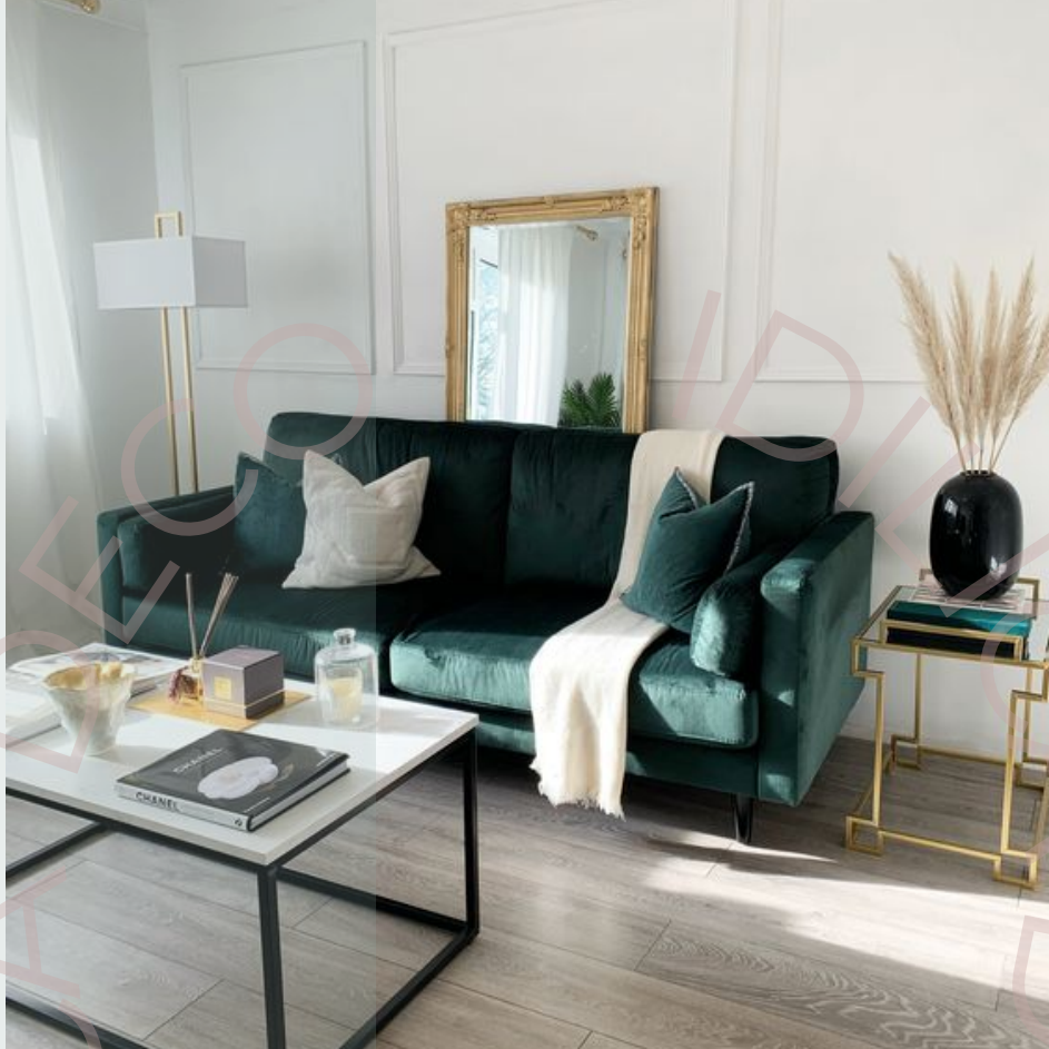
ejemplo de espacio con todas líneas rectas