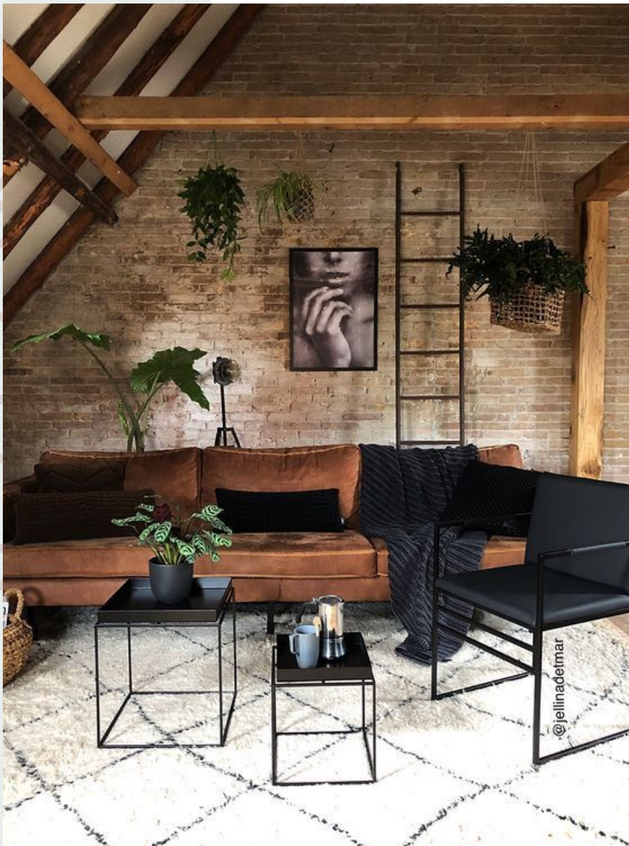
Ejemplo de estilo industrial gama de marrones, verdes y negro

El color es otro de los elementos. En cada estilo, predomina el uso de ciertos colores. Por ejemplo, en el estilo industrial predominan los colores negros, marrones, rojos, entre otros, pero nunca un fucsia.