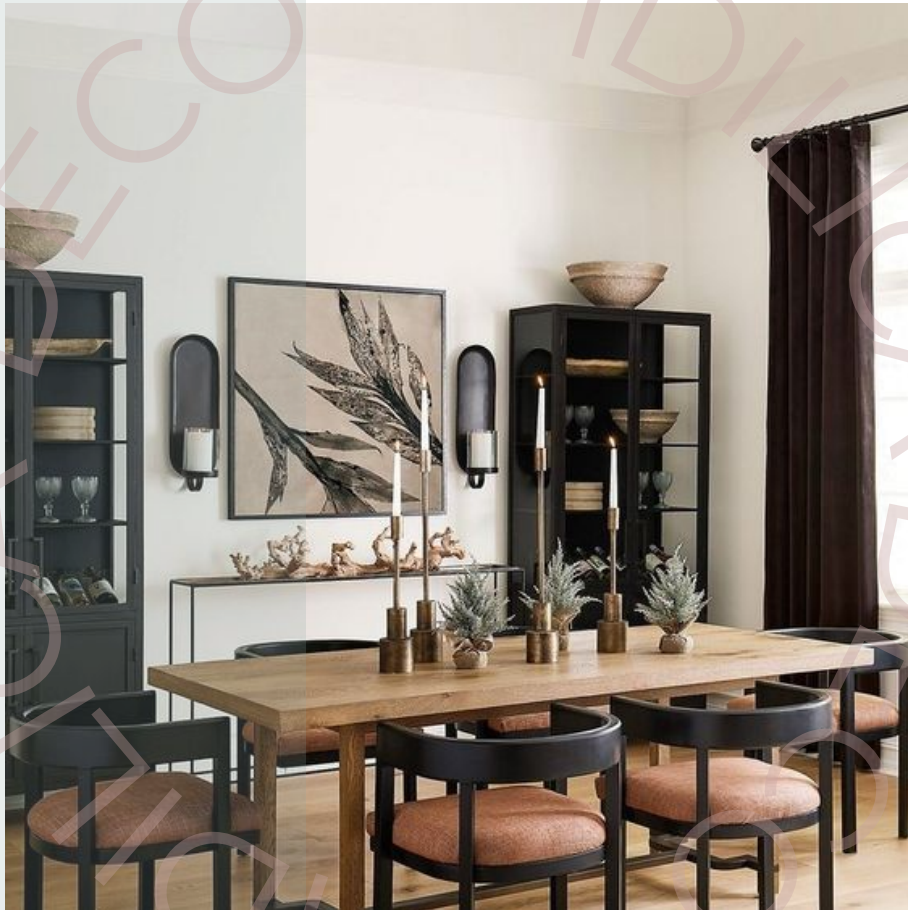
Se repite el negro y los tonos marrones rojizos (Patrón en colores)

El cuarto elemento de un estilo decorativo es el patrón. En diseño de interiores, un patrón es un tipo de tema, de sucesos u objetos recurrentes. El uso repetitivo definirá el estilo. Por ejemplo, si usamos los mismos materiales, líneas y estampas puede representar un estilo decorativo.