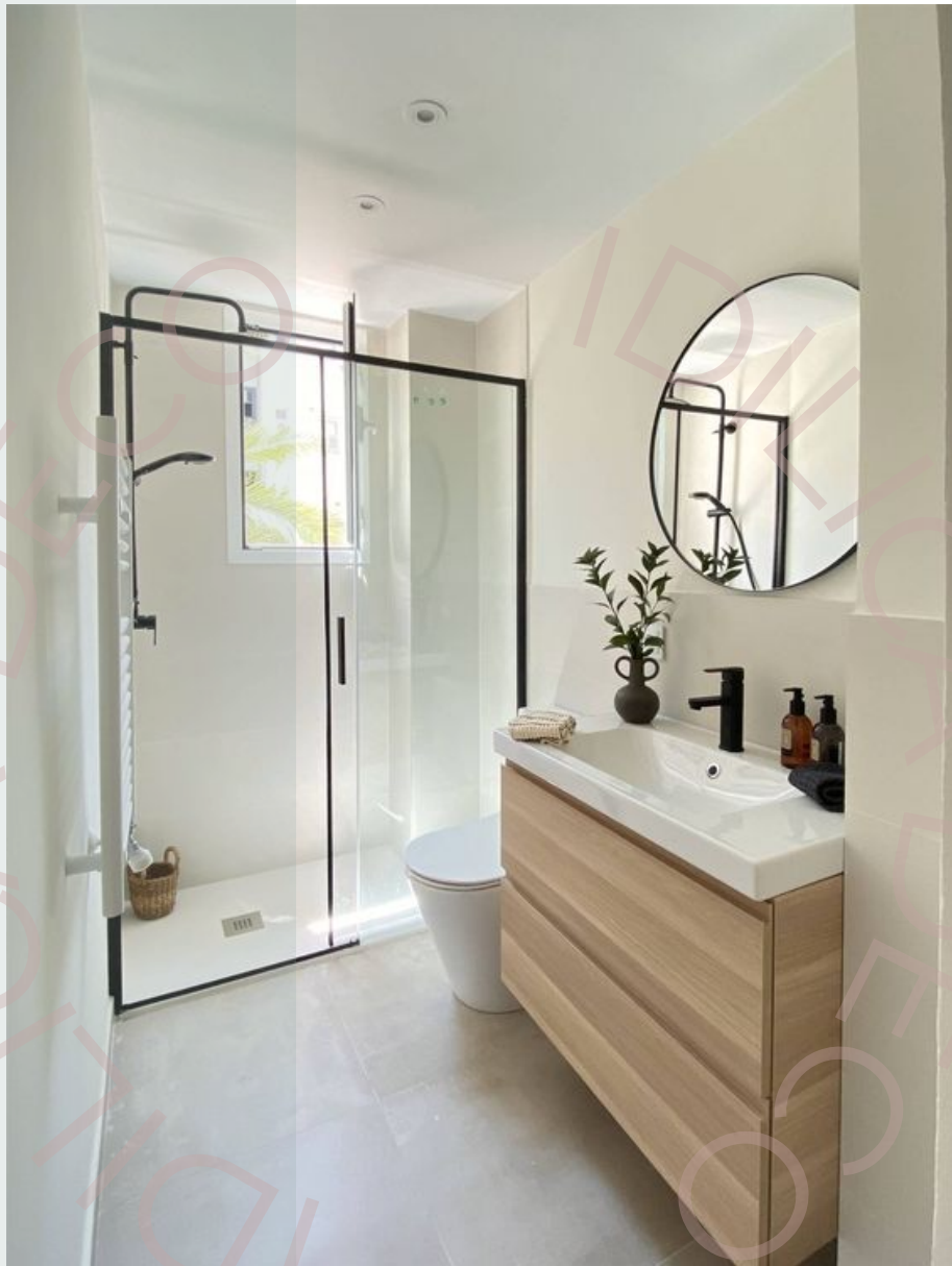
Ejemplo de espacio con texturas lisas