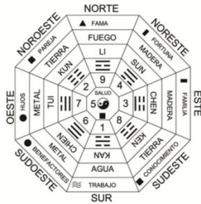
PAKUA – PUNTOS CARDINALES o de la Brújula

Para aplicar correctamente el PA KUA, primero deberemos hacer un reconocimiento del lugar (aplicando los conocimientos de la escuela de las Formas), luego conocer profundamente la problemática de los habitantes de la casa (preguntarse cómo funciona cada parte de su vida representada en el PA KUA.) y aplicar así el PA KUA. Recordar que el Chi es simétrico, cuando nos encontramos frente a viviendas que no conforman figuras geométricas equilibradas debemos estudiar si existen espacios sustractivos o aditivos.