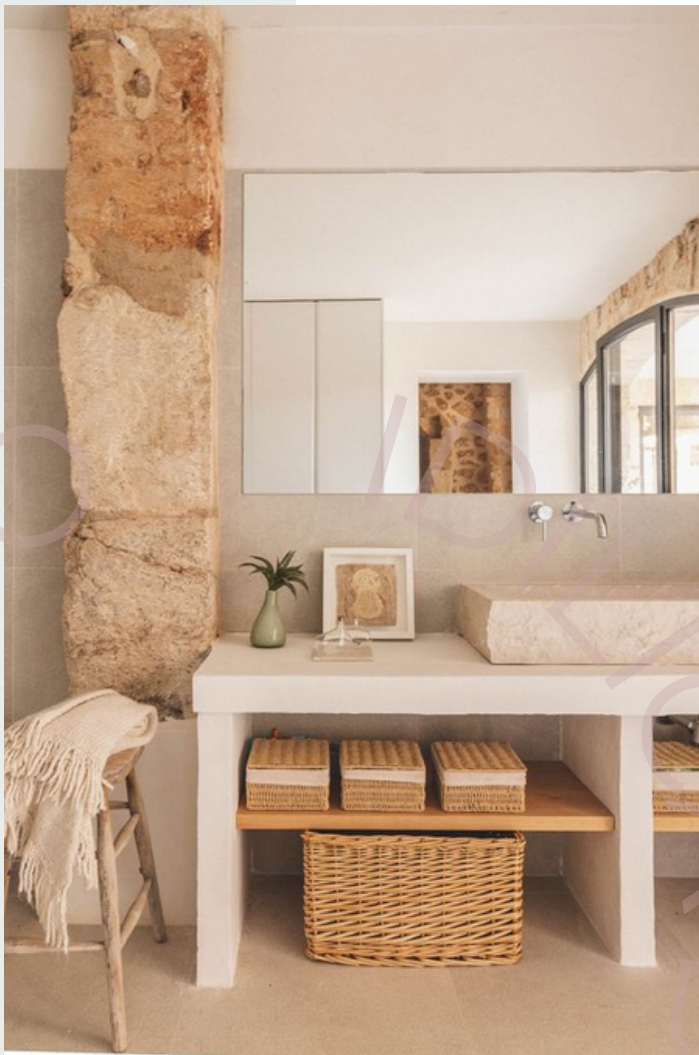
Ejemplo de espacio con texturas rústicas

Por ejemplo, si generamos un ambiente con mucho relieve, vamos a percibir que tenemos demasiados estímulos visuales. Y esto puede generar que el espacio se vea muy sobrecargado. De lo contrario, si optamos por todas superficies planas o lisas, el espacio lucirá monótono y sin gracia. Por eso, es súper importante combinarlas.