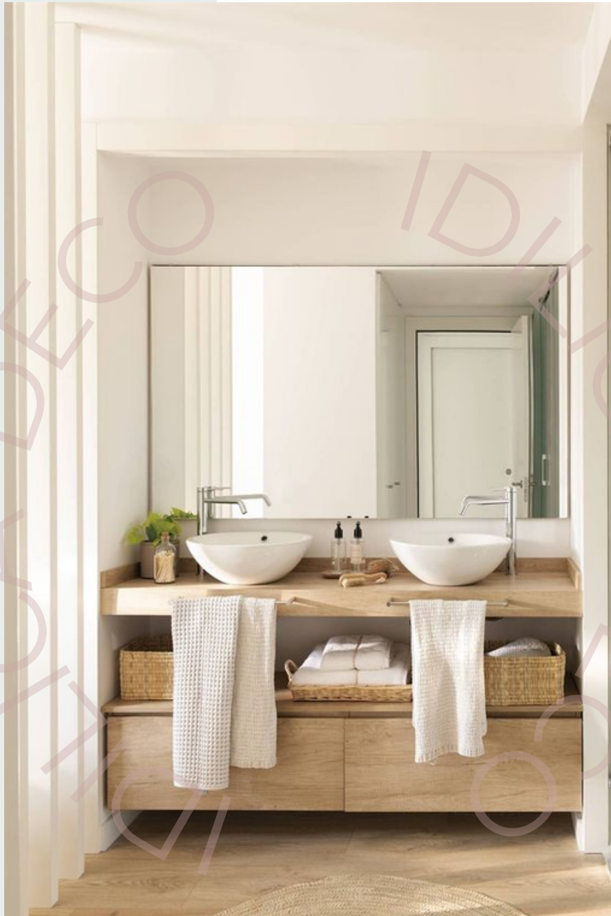
Ejemplo de espacio con texturas lisas