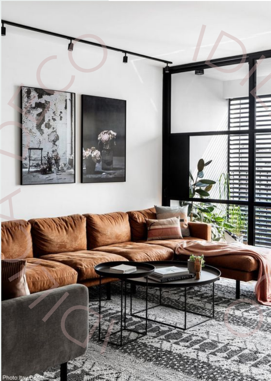
Ejemplo de estilo industrial gama de marrones, verdes y negro

En el diseño de interiores, el color es una de las piedras angulares más influyentes y versátiles que se utilizan para dar forma y personalidad a los espacios. Se trata de una característica visual que impacta profundamente en la percepción emocional, la atmósfera y la estética general de un ambiente.