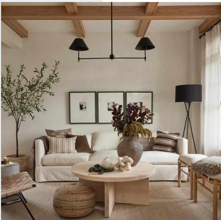
Combinación de líneas rectas y curvas balanceada

Para aquellos que buscan trascender lo ordinario, romper estas líneas uniformes emerge como una recomendación valiosa. El cómo emprender esta ruptura puede definirse mediante pequeños cambios estratégicos.