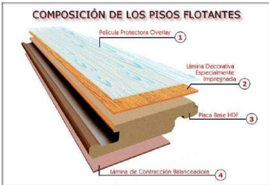
Lámina estabilizadora: es una lámina de balance que provee apoyo y estabilidad al piso y funciona como una capa anti-humedad.

Sustrato: es el cuerpo del piso y se compone de MDF o HDF con tratamiento antihumedad. Las siglas MDF (medium density fibreboard -tableros de fibra de densidad media) o HDF (High density fibreboard - tableros de fibra de densidad alta) designan justamente el nivel de densidad de cada calidad.